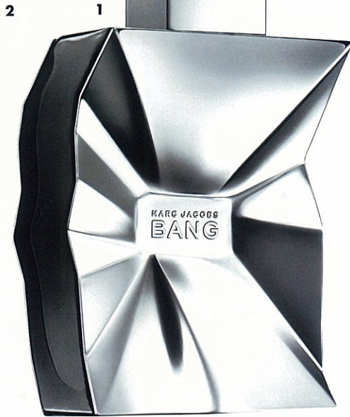
1 3種のペッパーが香るオードトワレ「BANG(バンク)」(50ml)7,350円(12月8日発売予定) 2 マーク本人が広告キャンペーンに登場。