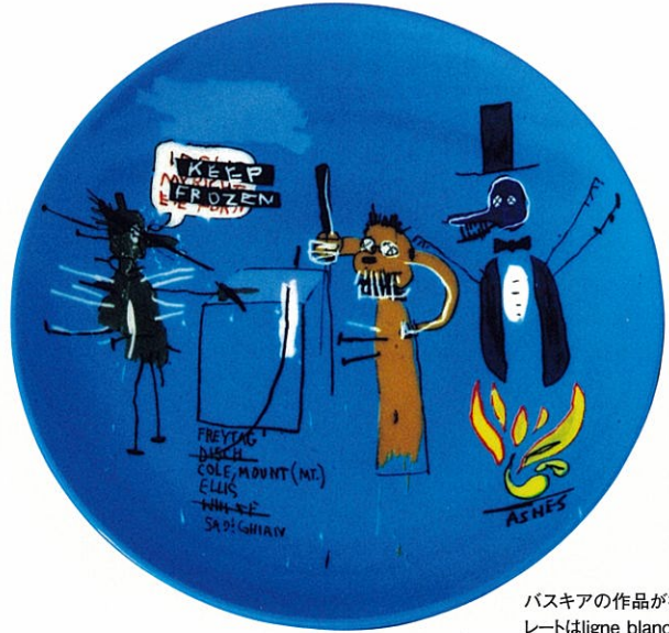
バスキアの作品が描かれたプレートはligne blanche parisの製品。2種類で展開中。www.ligneblancheparis.com/